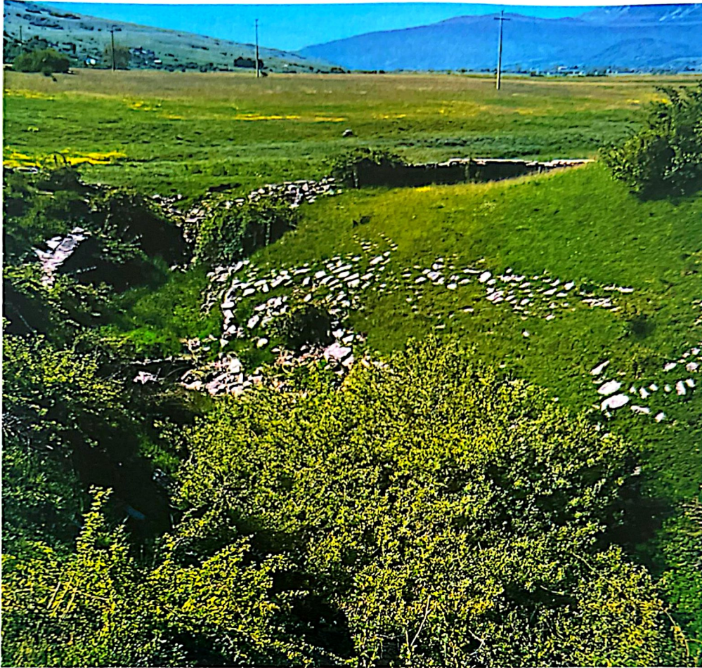
Slika 4. Mlin ispod Gradine Dubrave (Mliništa-Paripovac 82)