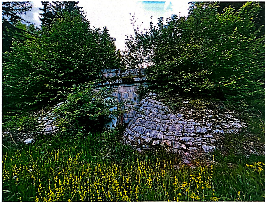
Slika 13. Rezervoar Busija (Staretina- Golija 70)