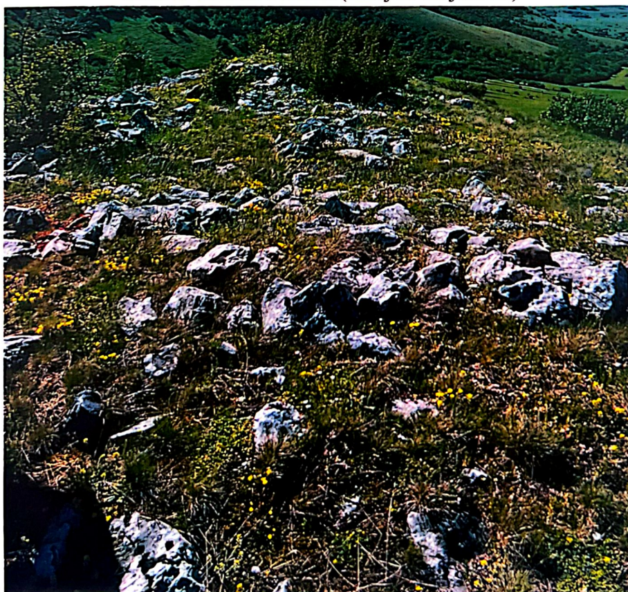
Slika 3. Gradina Palanka (Hrbljine-Kujača 28)