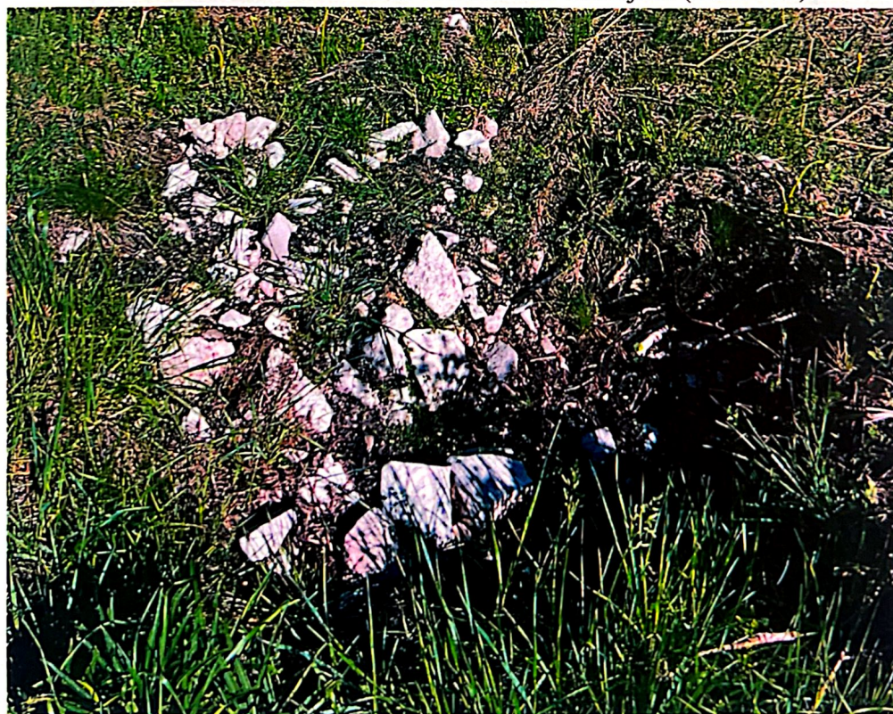
Slika 9. Gradina iznad Runjića (Bunarić 95b)