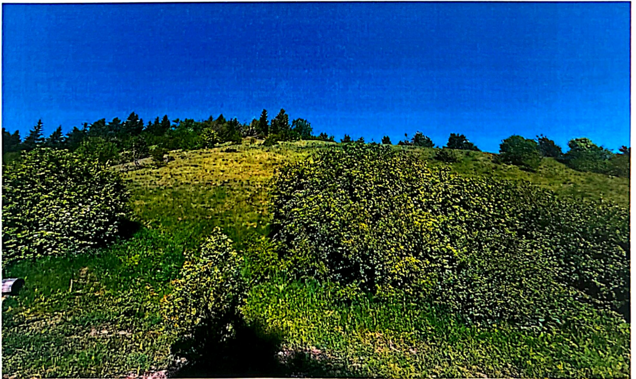
Slika 7. Podgradina Gradina (Staretina-Golija 49d)