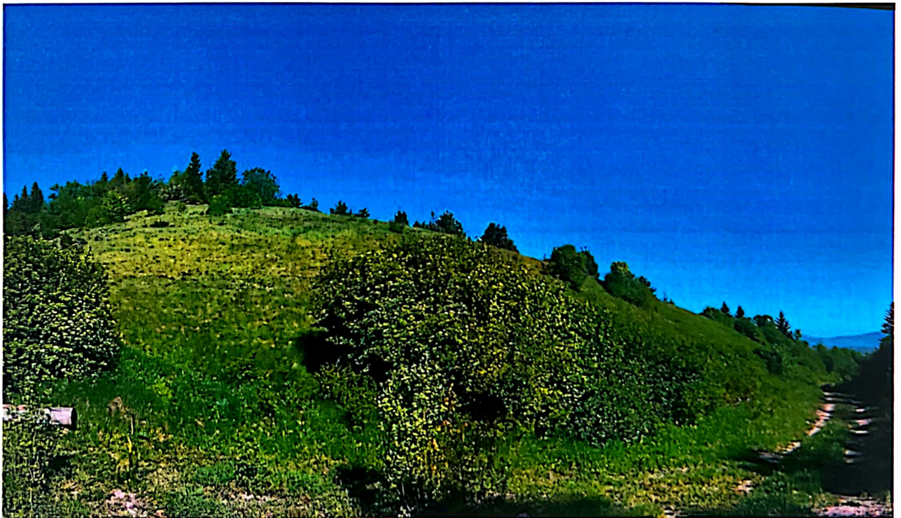
Slika 5. Gradac (Staretina-Golija 115/1c)