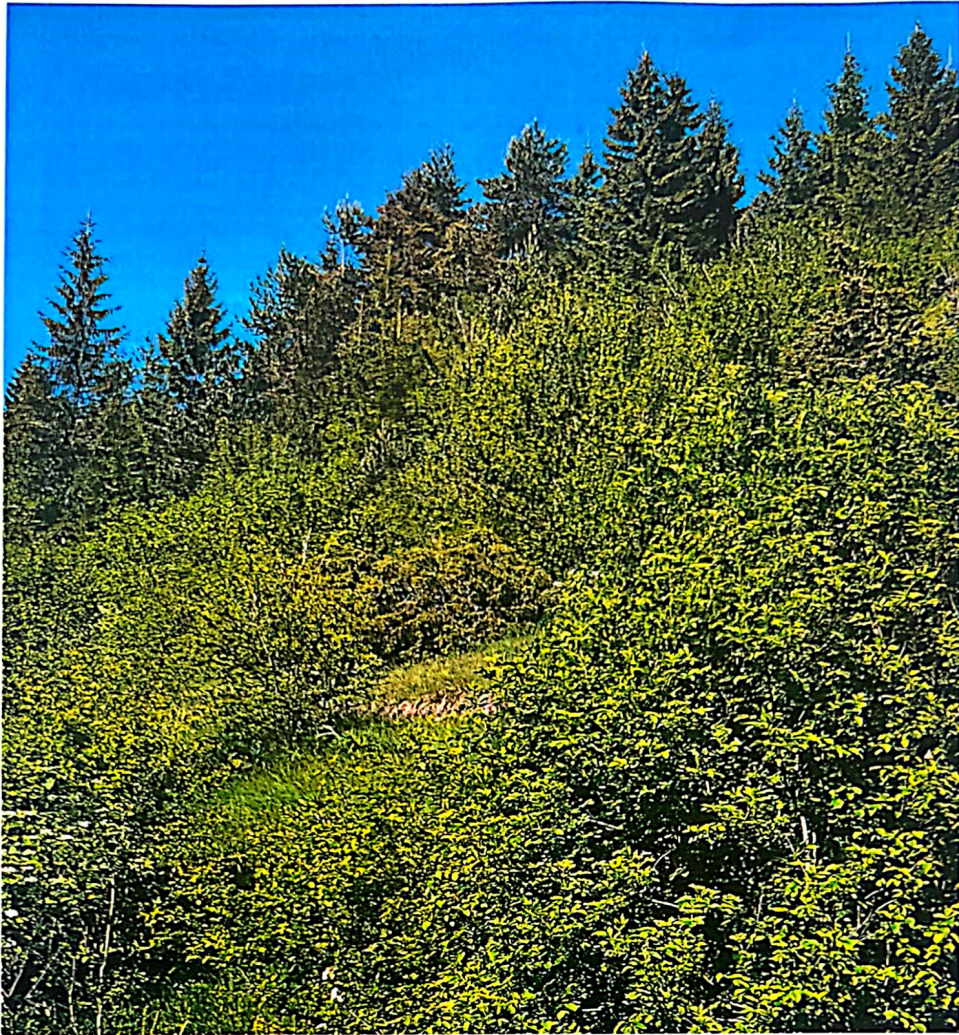
Slika 6. Medvjedgrad (Staretina-Golija 76a)