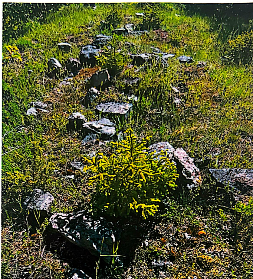
Slika 8. Soldatova ili Velika Gradina kod Šumnjaka (Šator 50d)