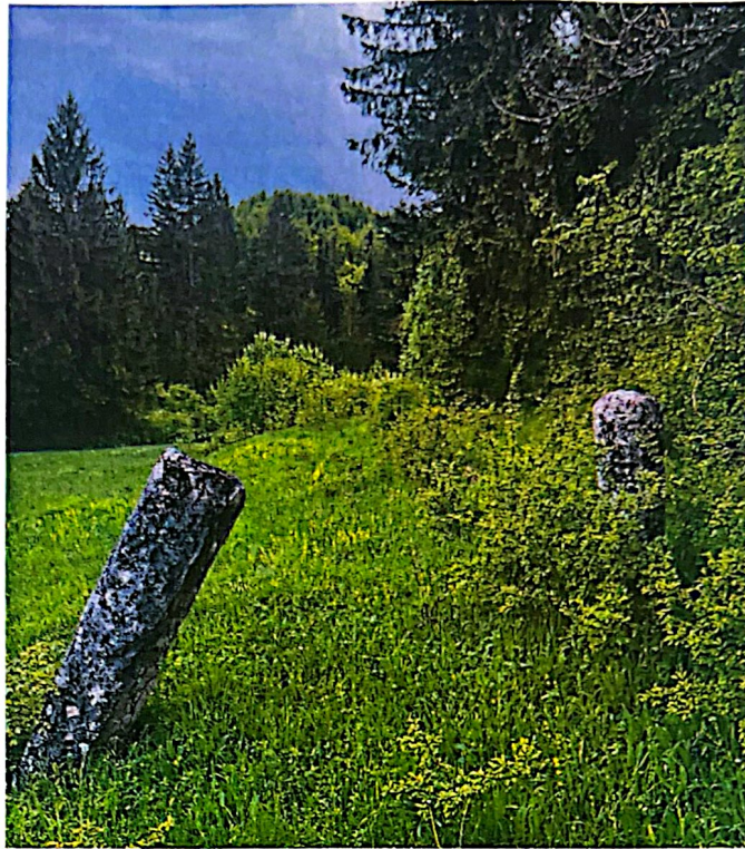
Slika 12. Rimski put soli (Staretina-Golija 70)