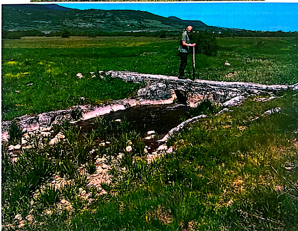
Slika 1. Gradina Skucani i mlin ispod objekta (Hrbljine-Kujača 92b)