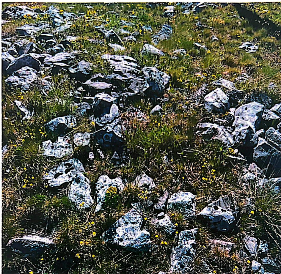
Slika 2. Gradina Palanka (Hrbljine-Kujača 28)