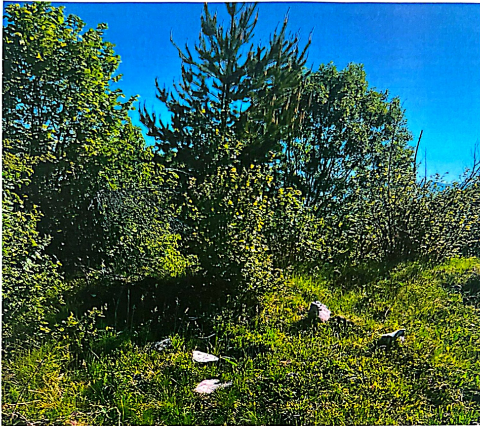
Slika 10. Gradina Hotkovci (Bunarić 98b)