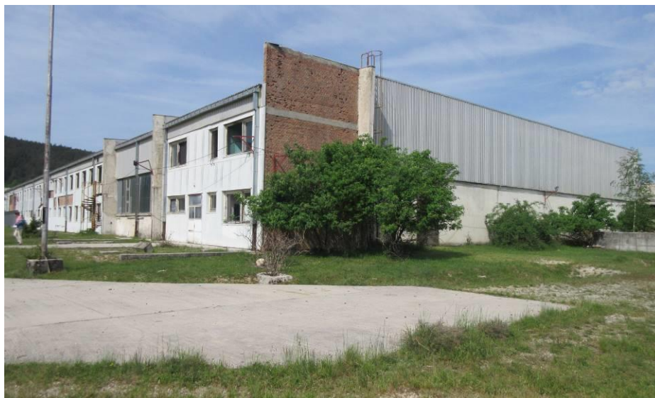
Slika 1. Objekt bivše tvornice namještaja u Glamoču, sjeverna i istočna fasada

( bivša " Tvornica namještaja i elemenata za namještaj")