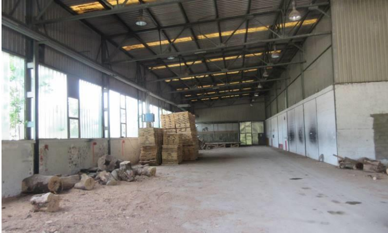
Slika 5. Jugozapadni dio hale I