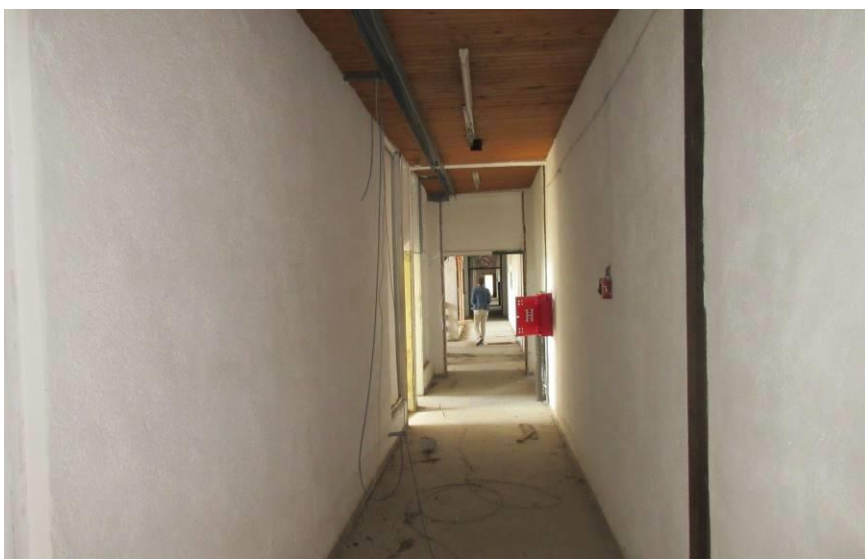
Slika 10. Hodnik uredskih prostorija