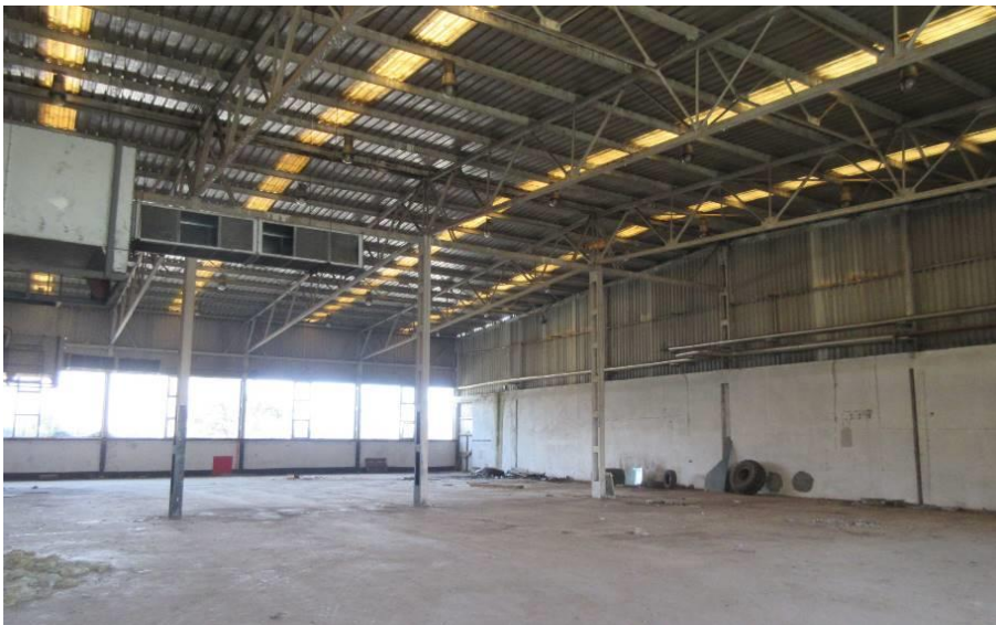
Slika 8. Dio hale III, sjeverni dio