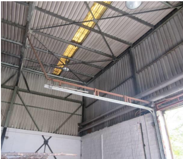
Slika 4. Konstrukcija i ulaz I