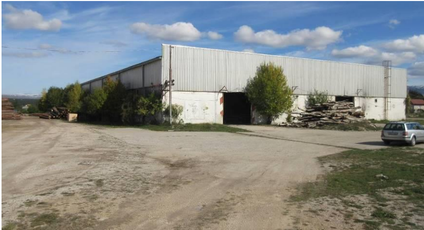
Slika 3. Zapadna i južna fasada tvorničke hale