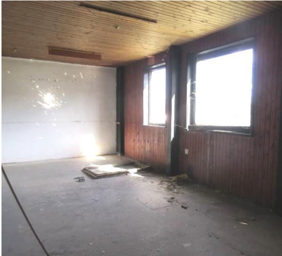
Slika 11. Detalj uredskog prostora