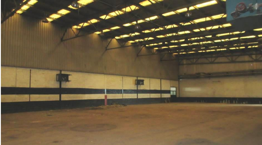
Slika 7. Dio hale II