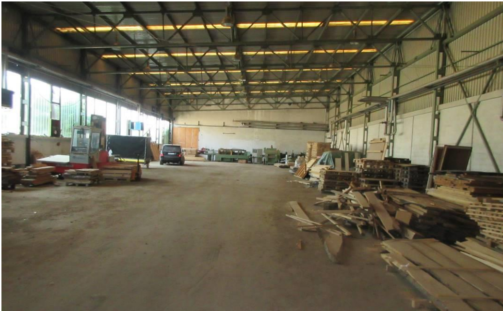
Slika 6. Dio hale I