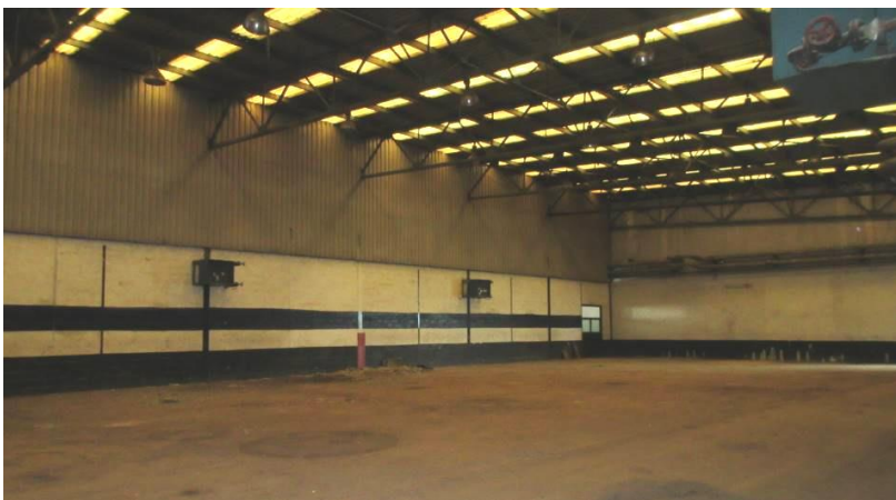
Slika 5. LOT I. - jugoistočni dio tvorničke hale