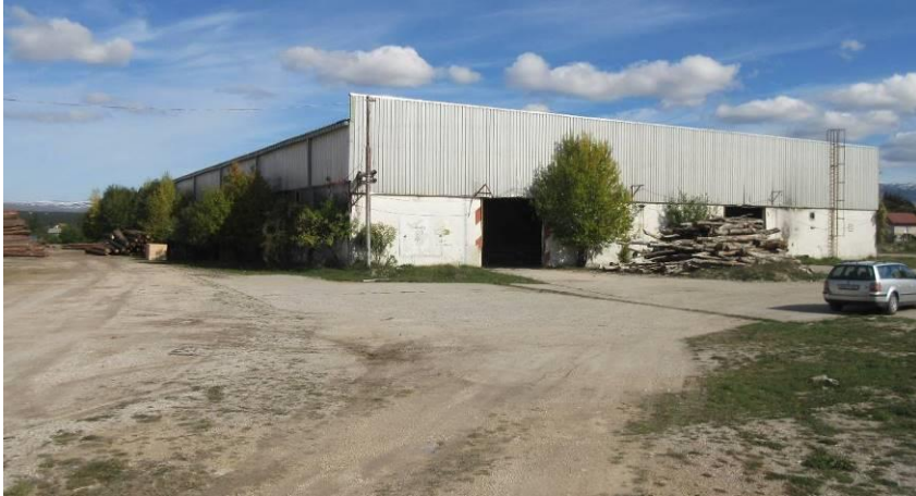
Slika 3. Zapadni i južni dio tvorničke hale