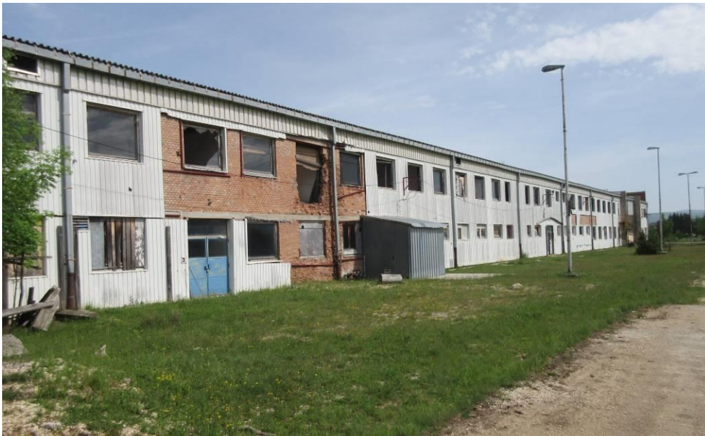
Slika 2. Pomoćne prostorije uz halu, jugoistočni dio