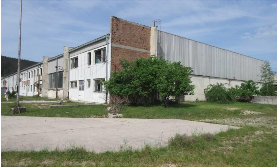
Slika 1. Objekt bivše tvornice namještaja u Glamoču, sjeveroistočni dio

( bivša" Tvornica namještaja i elemenata za namještaj")